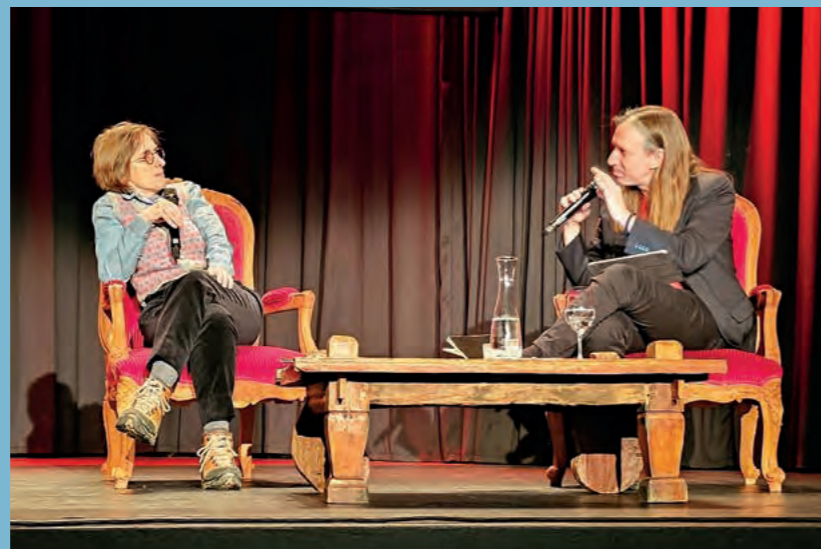
A. L. Kennedy im Kaufleuten Zürich

Alle unsere Autorinnen und Autoren stehen für Lesungen zur Verfügung. Wir freuen uns auf Ihre Anfrage: info@gepardenverlag.ch