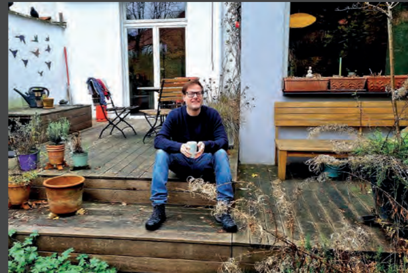
Unser Besuch bei Milo Rau in Köln