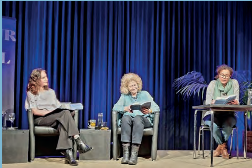
Michal Govrin im Literaturhaus Basel